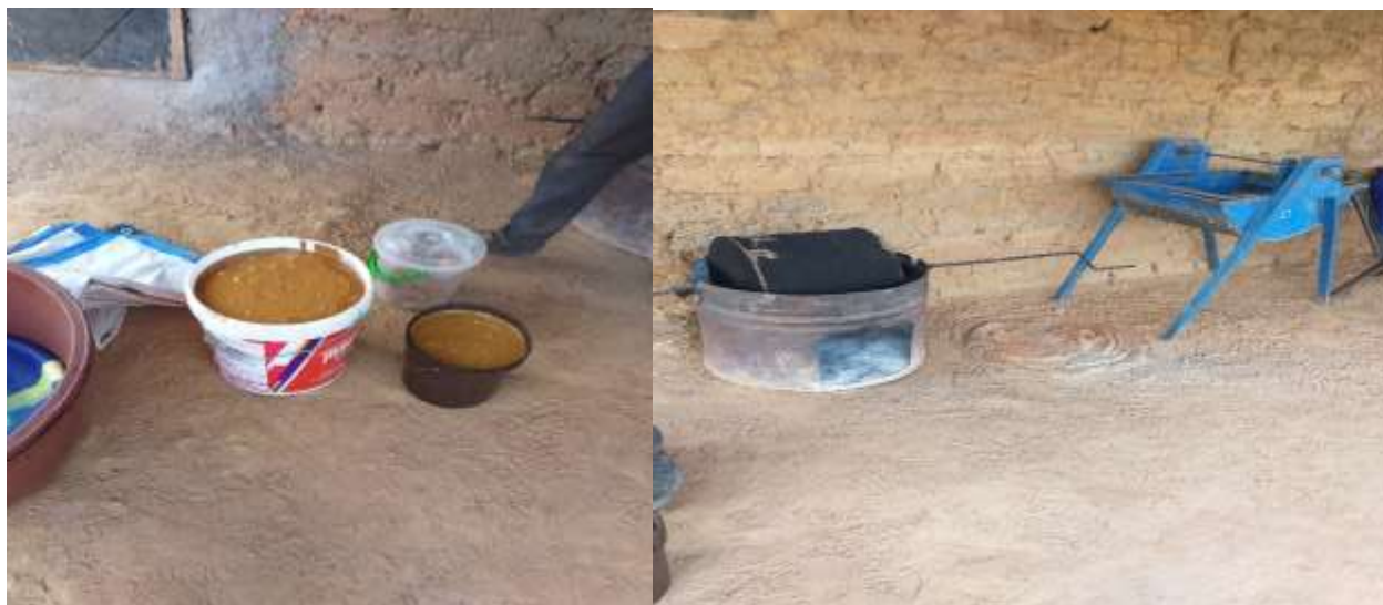
Aperçu du site du bénéficiaire