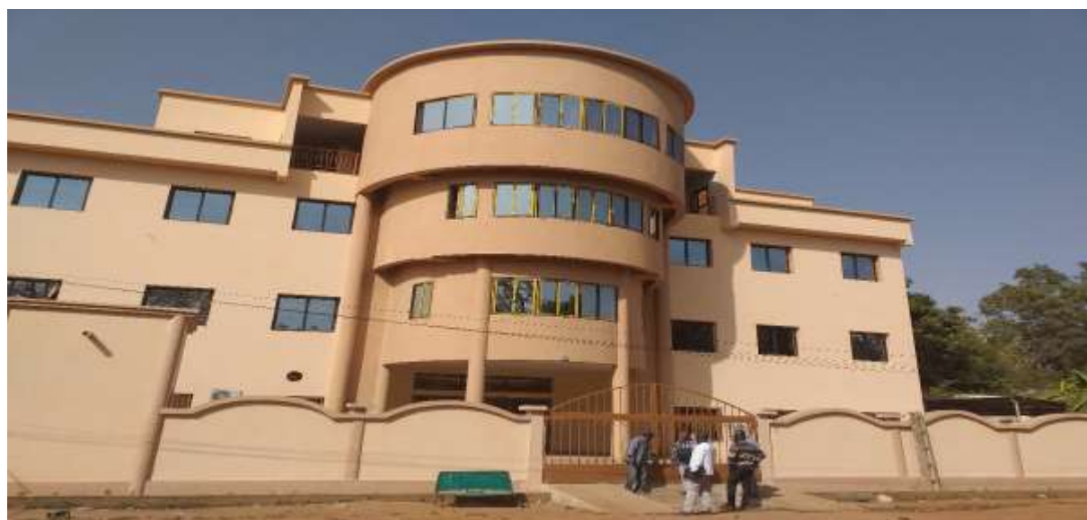
Aperçu de la façade de la DRDCB

A la date du 13 janvier 2020, le chantier de construction de la Direction Régionale a connu sa phase de réception provisoire avec une réserve portant sur l'application d'une couche de peinture dans les toilettes.