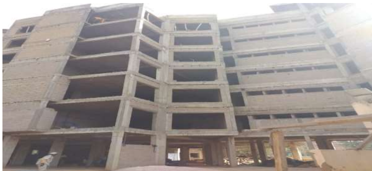
Aperçu du chantier de la DNDC