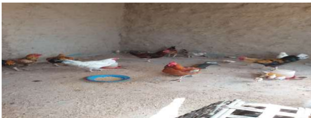
Aperçu du poulailler du bénéficiaire