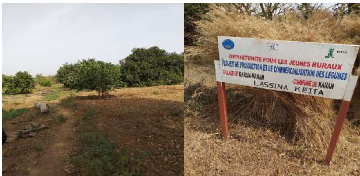
Aperçu du site de Lassana KEITA