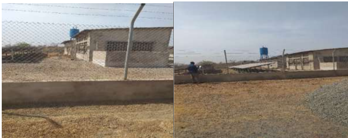
Aperçu du site de Kassaro

A travers une vue extérieure de la centrale nous constatons la présence deux(02) bâtiments, un abri cuve de stockage carburant le champ solaire et un château d'eau dans une clôture réalisée dans la cour du projet.