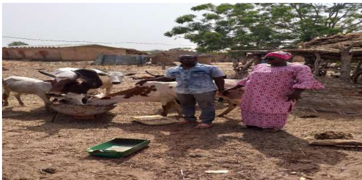
Aperçu du site du bénéficiaire