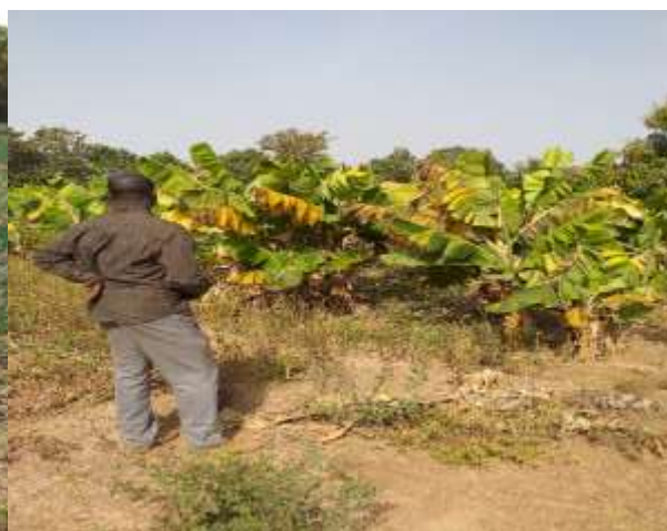
Aperçu du site du bénéficiaire