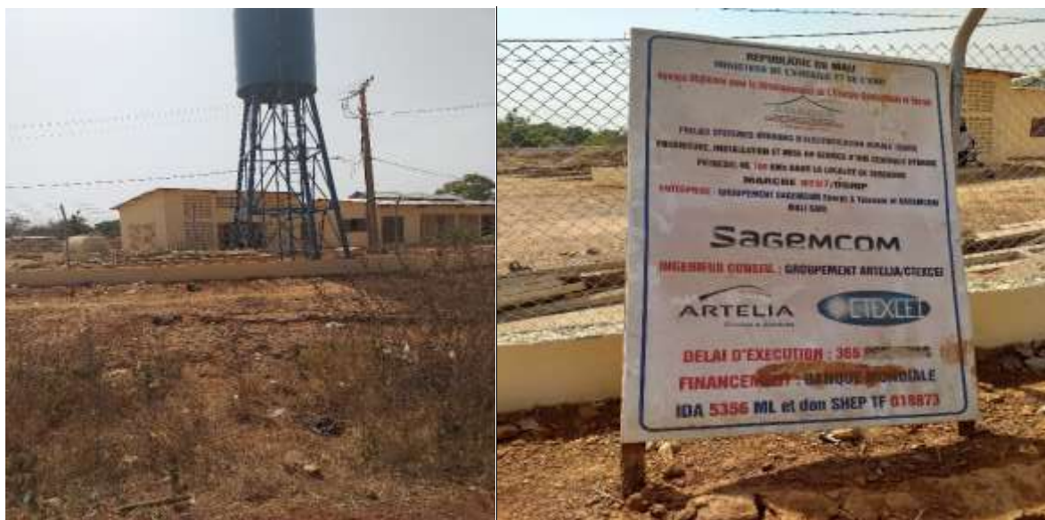
Aperçu du site de Sébécoro

Site de Kassaro : l'accès à ce site n'a pu être possible en raison de nouvelles dispositions au niveau de l'entreprise ayant consistées à ne plus maintenir un gardien des lieux, donc à boucler toutes les issues avant le redémarrage des travaux.