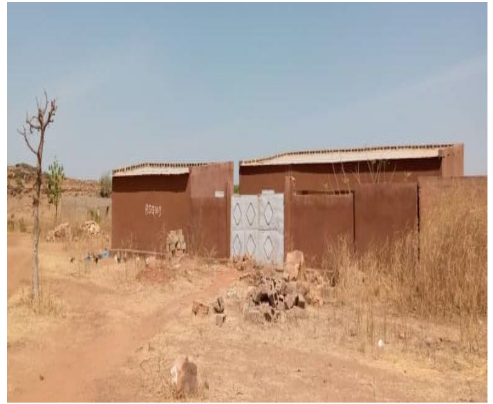
Zone à démolir