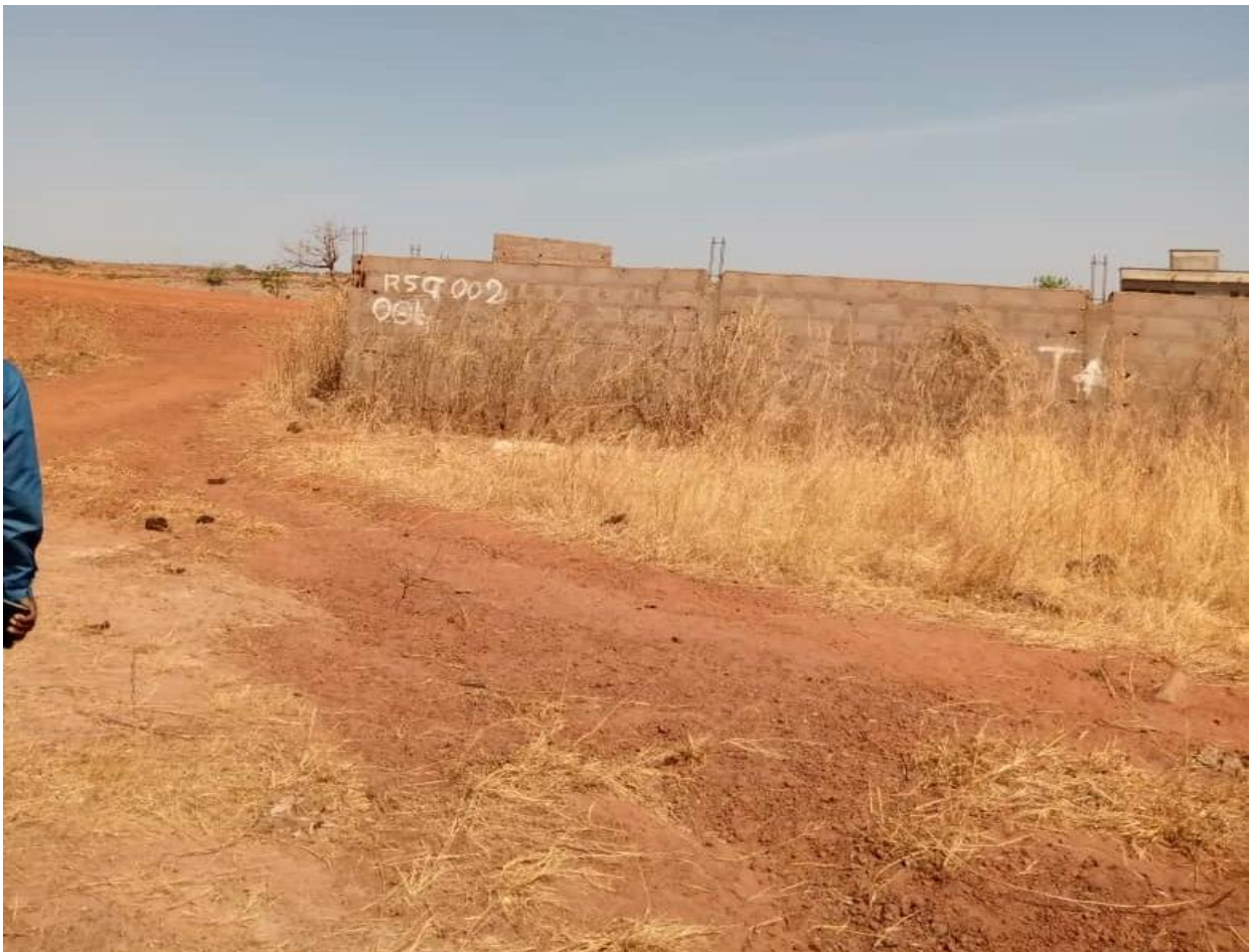
Zone à démolir