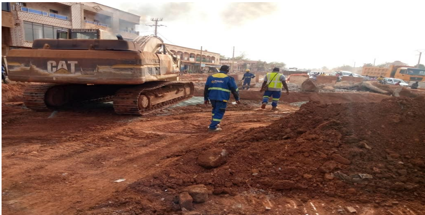
La voie reliant le 3 ème Pont à la RN 6