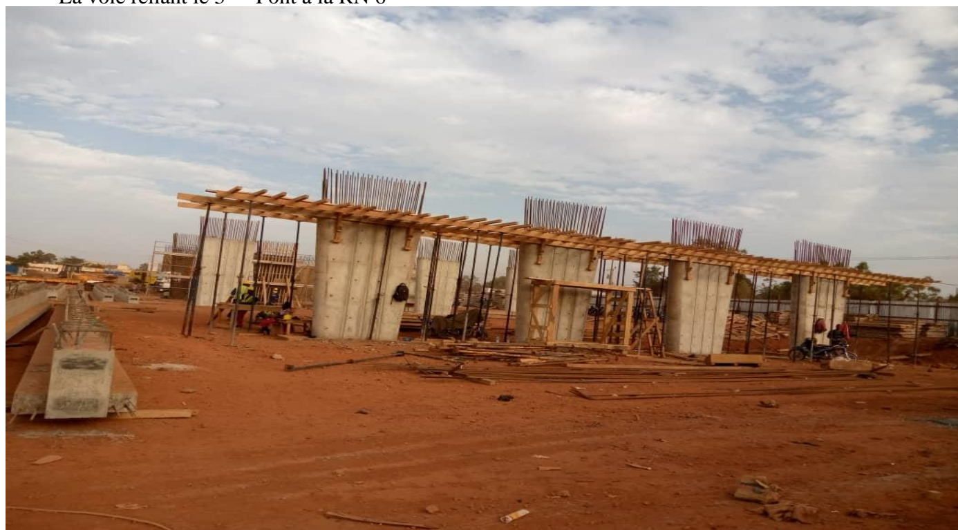
Les pieds de l'Echangeur