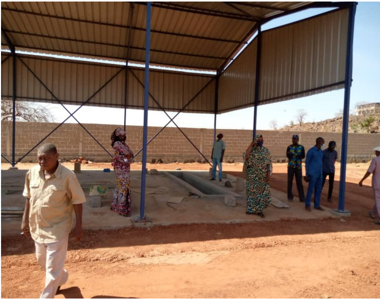
Base vie de l'entreprise